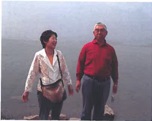
キャンモア近郊、山火事の煙でいっぱい