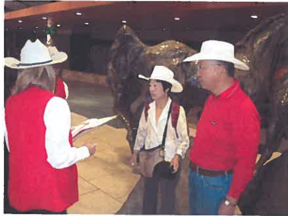
White Hat reception for arrival in Calgary!