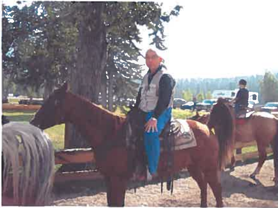
Frist time experience, horse back riding in Banff!