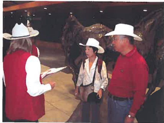
カルガリー到着祈念の白いカウボーイハット贈呈式