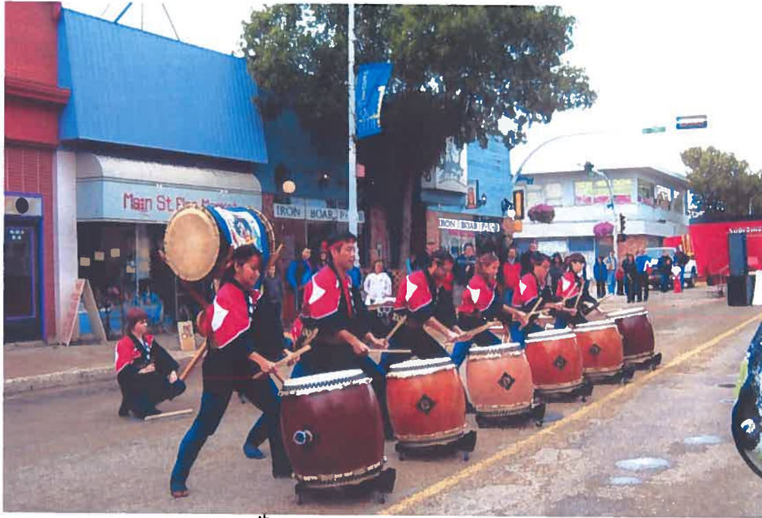
Kita-No-Taiko Group: Our 20 th Anniversary Gift to Our Community