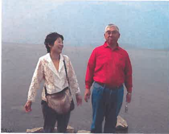
Forest fire smoke filled the air near Canmore.