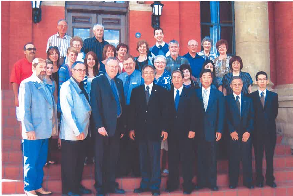
2010 Adult Delegation from Ashoro and Wetaskiwin Friendship Society