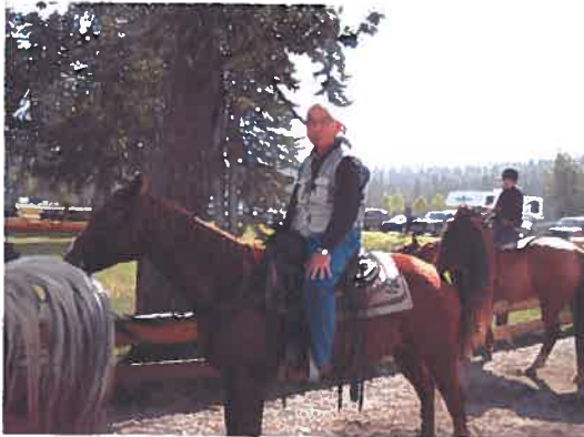
バンフで乗馬初体験