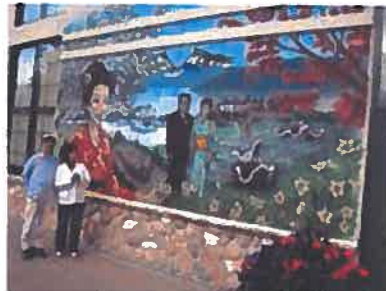
ストーニープレーン町