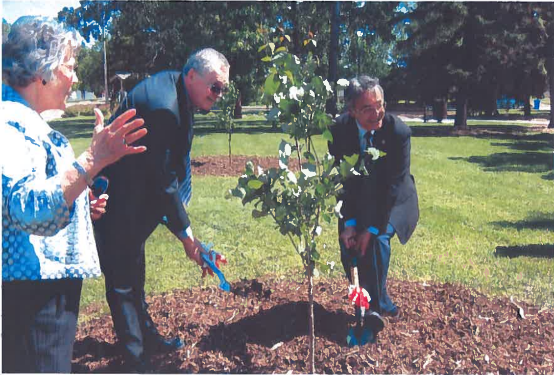
Planting of Japanese Lilac for 20 th Anniversary

2010 was also the twentieth anniversary of Wetaskiwin's twinning with Ashoro and in celebration of this the Friendship Society arranged for Kita-No-Taiko, a taiko drummer group from Edmonton, to be at Wetaskiwin's first annual Arts and (agri)Culture Festival in September. Their inspired performance of this art was so well received that the festival planners are hoping to be able to have them again this year.